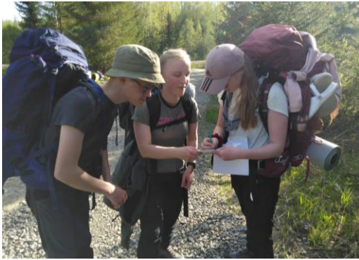
Kuva: Sari Makkonen